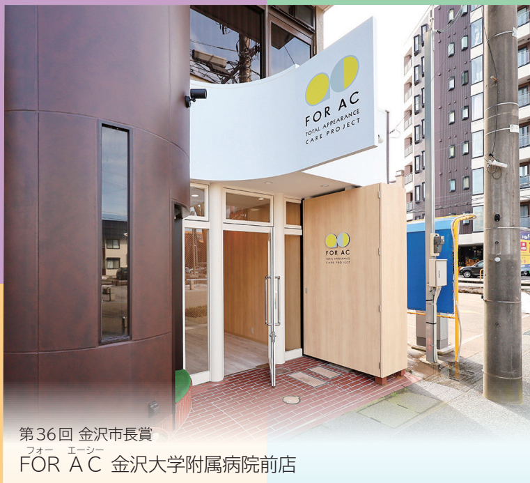
第36回 金沢市長賞 フォー エーシー FOR AC 金沢大学附属病院前店