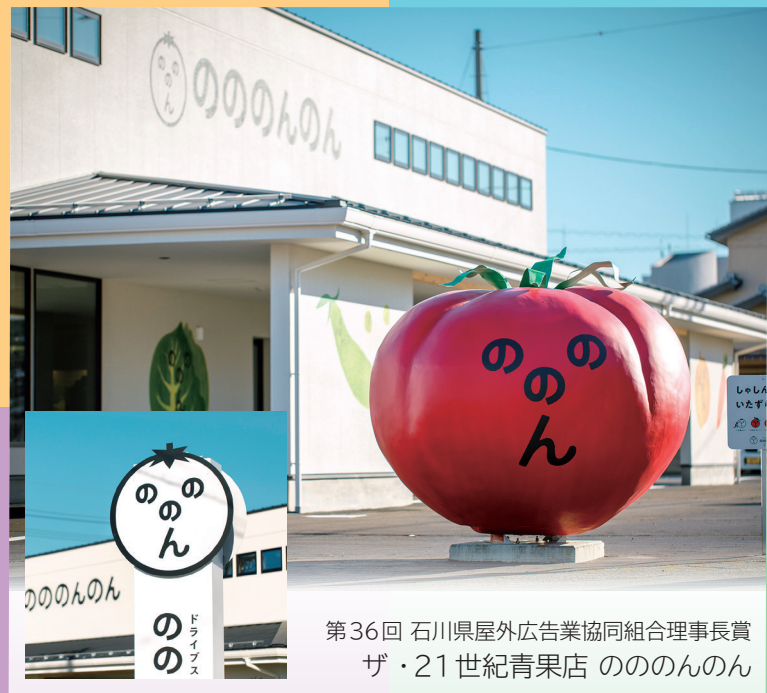
第36回 石川県屋外広告業協同組合理事長賞 ザ・21世紀青果店 のののんのん